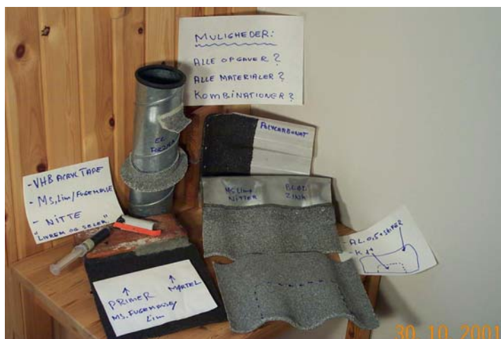
Mulighed for mange materialekombinationer

Materialet kan limes med konstruktionskvalitet med samme silanmodificerede polymer mod sig selv og mange andre bygningsmaterialer. Limen er ensartet fleksibel i temperaturområdet - 40 til + 90 grader C. Der er altså ikke tale om termoplastiske egenskaber, hvor limen bliver blød ved opvarmning i solen.