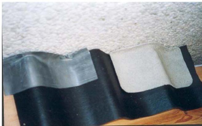
Bly og PEM-K udgave september 1999 med sand som øverste lag

Efter indledende møder, hvor produktkrav blev formuleret, gik jeg i gang med at udvikle et formbart produkt.