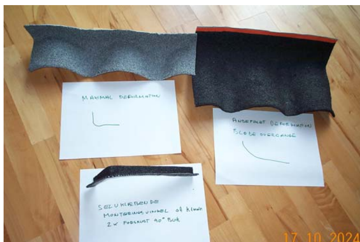
Eksempel på maksimal og anbefalet deformation samt en selvklæbende multifleksibel monteringsflange

Materialet kan limes med konstruktionskvalitet med samme silanmodificerede polymer mod sig selv og mange andre bygningsmaterialer. Limen er ensartet fleksibel i temperaturområdet - 40 til + 90 grader C. Der er altså ikke tale om termoplastiske egenskaber, hvor limen bliver blød ved opvarmning i solen.