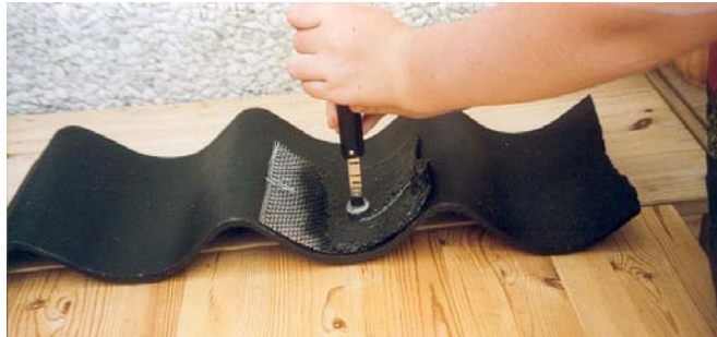
Måling af deformationstryk samt tilbagefjedring

Senere på året kom der oplæg fra Teknologisk Partnerskab, hvor der blev efterspurgt alternativer til bly til taginddækninger. Her var der en udfordring, og jeg meldte ind på opgaven med de indledende idéer til udvikling af et nyt kompositmateriale.