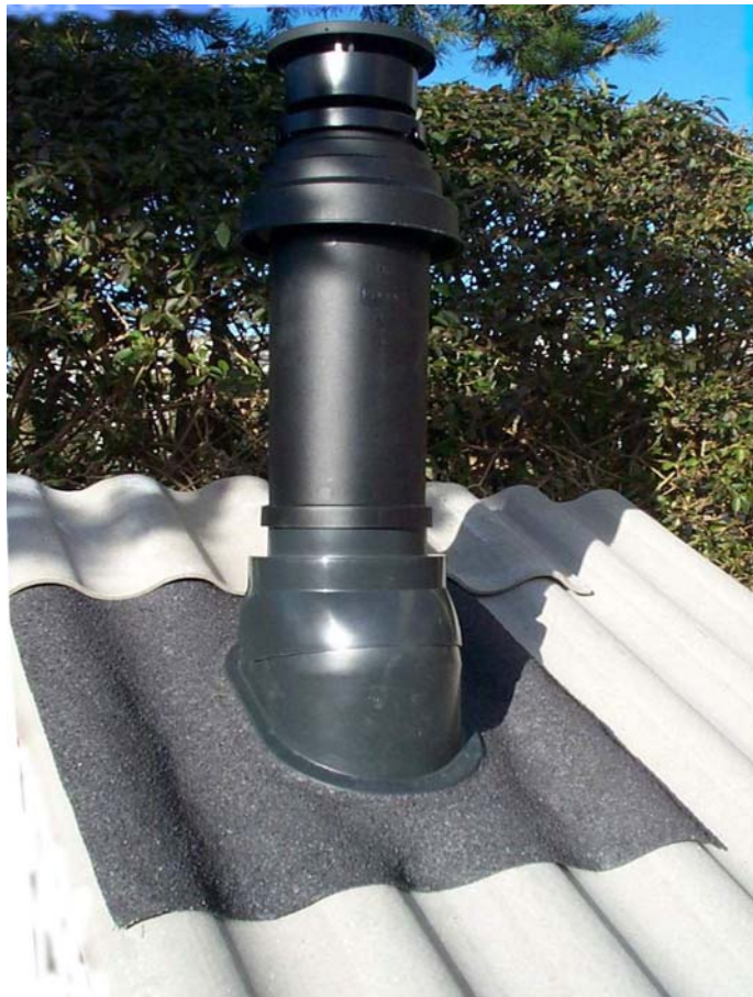
Bosch gennemføring med PEM-Komposit

Produktet er umiddelbart enkelt at fremstille ved håndkraft i mindre arealer. Der har været mange overvejelser vedrørende produktionsmetoder. Specielt formmaterialets opbygning, tykkelse, overflademønster med videre. Indledende test er foretaget med enkle midler, ligesom muligheder er vurderet for anvendelighed i en fortløbende produktion. Her i produktionsudviklingsfasen fortsætter denne aktivitet som er grundlag for valg af metoder og konstruktion af produktionsudstyr.