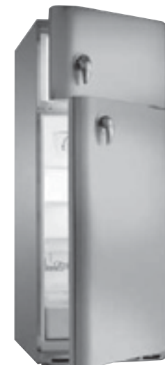
RD L 45 IX

Indret ikke nyt køkken, før du har valgt hårde hvidevarer. Det er lidt ærgeligt at have sat 60 cm. af til køleskab, hvis det køleskab du falder for er 70 cm. som f.eks. det eksklusive Scholtes køle/fryseskab i rustfrit stål, designet af Philippe Starck, med tilhørende vakuumpakker og skåle.